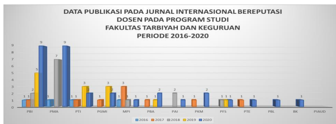
Gambar 4.1 Grafik Data Publikasi

Data publikasi dosen Fakultas Tarbiyah dan Keguruan UIN Ar-Raniry pada jurnal internasional bereputasi adalah sebagai berikut: